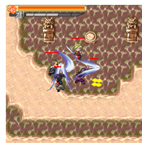
「侍道 契」イメージ画像 ※掲載画像の無断転用禁止