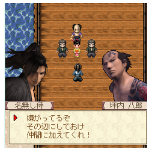
「侍道 契」イメージ画像

会話を進めたり、突然斬りつけて戦ったり、その間、どのように過ごすかはプレイヤーの自由です。正義の用心棒となるか悪の化身となるか…数々の登場人物と会うこととなりますが、どのような形で会うかもプレイヤー次第です。繰り返しプレイすることで共に戦った者といつか争うこともあるでしょう。