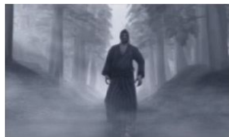
「侍道 契」イメージ画像 ※掲載画像の無断転用禁止

時は明治10年(1877年)、反乱を起こした士族がことごとく敗れ去った最後の年(西南戦争の年)。舞台は某街道の寂れた宿場町・六骨峠。ヤクザに成り下がった士族の黒生家(くろふけ)と明治政府に不満を抱く不平士族集団の赤玉党とが、黒生家の建てた新型製鉄所を巡って抗争を続けている。そして、その隙をうかがい漁夫の利を得ようとする明治政府と三者の思惑に翻弄される宿場町の人々。主人公はこのまただ中に刀一振下げてふらりと迷い込んだ侍である。どの陣営に付くか、どのように行動するかはプレイヤー次第。滅び行く侍たちの運命はどのようなものなのか。