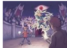
イメージ画像 ※掲載画像の無断転用禁止

すごろくモードでカスタマイズした歴戦のでびる box をサーバーに UP することによって、全国のプレイヤーと擬似対戦を楽しむことができ、対戦成績や全国ランキングが確認できます。腕試しに全国のライバルと対戦し実力を鍛え、全国ランキング上位を目指してがんばってください。