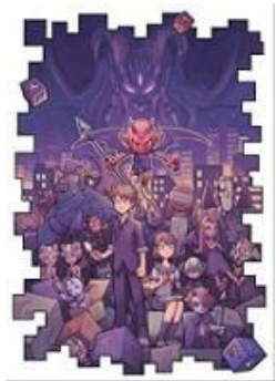
「でびる box」イメージ画像 ※掲載画像の無断転用禁止