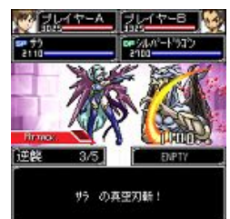
ゲーム画面イメージ画像